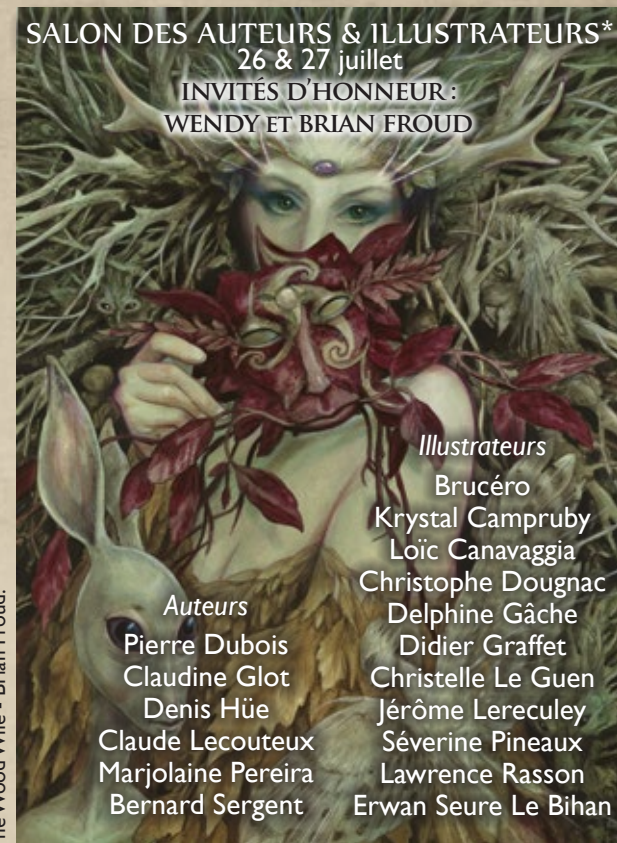
The Wood Wife - Brian Froud.

INVITÉS D'HONNEUR : WENDY ET BRIAN FROUD